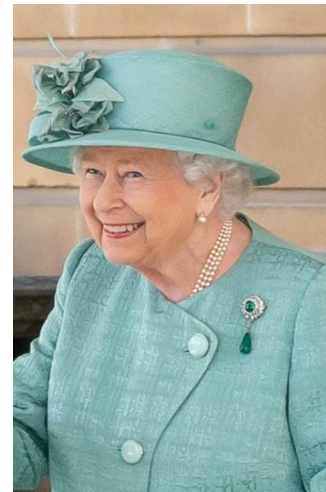
Queen Elisabeth II